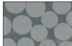
MIコア ファイバーポスト 横断面 (ファイバー充填率=77wt%)

MIコア ファイバーポストは、直径約14μmのファイバーガラスを縦方向に均等かつ密に束ね、レジンで包埋しています。