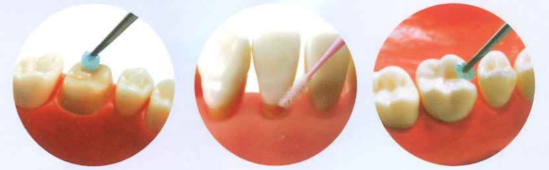
シーリング・コーティング

「BioコートCa®」及び「ハイブリッドコート™II」は、歯質表面を薄く硬い被膜でコーティングし、形成後の外来刺激や二次う蝕から歯質を守ります。 シーリング・コーティング以外にも知覚過敏抑制材、ボンディング材としてもご使用いただける、マルチユースな材料です。