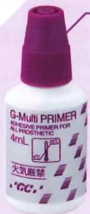
歯科セラミックス用接着材料 管理医療機器 228AABZX0003000