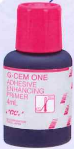
歯科用象牙質接着材 管理医療機器 228AKBZX00104000